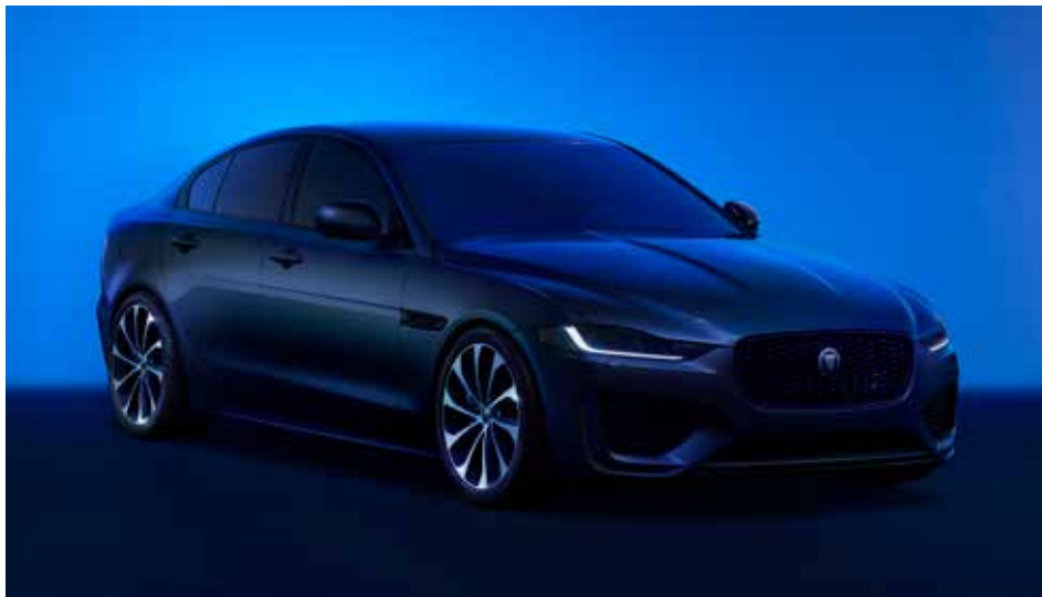
XE R-DYNAMIC SE